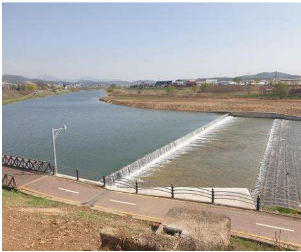
가동보 시공 현황