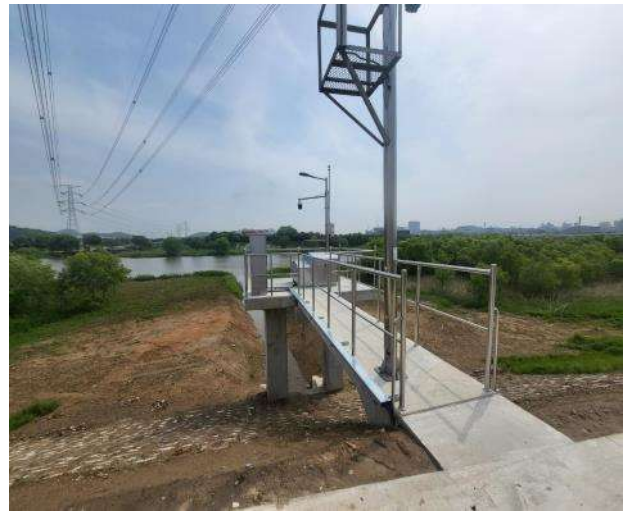
배수문 시공 현황