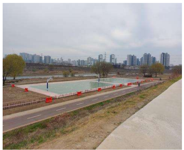
하천환경정비공(체육시설) 시공 현황