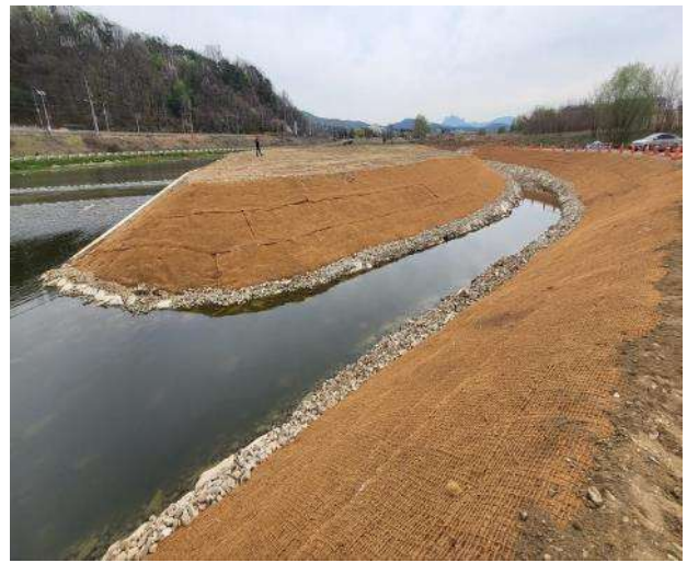
인공하도식어도 시공 현황