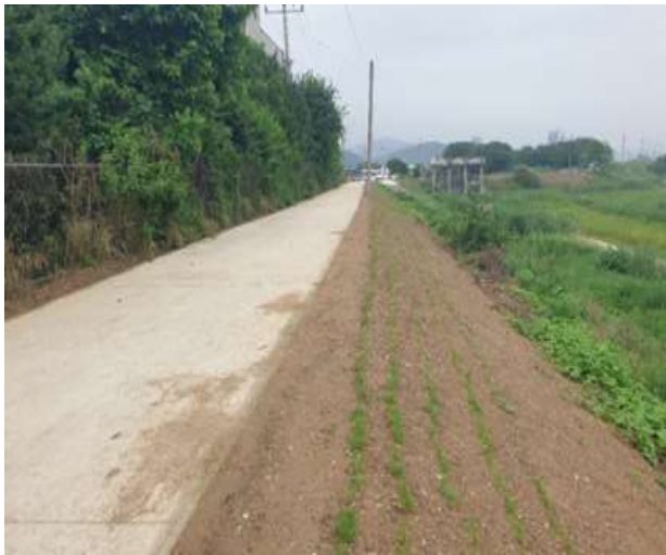
제방보강공 시공 현황